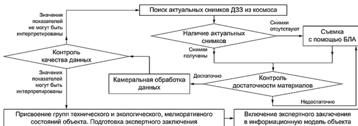
Рисунок 3 - Алгоритм оценки технического и экологического состояния мелиоративного объекта дистанционными методами

10.2 Алгоритм оценки технического и экологического состояния мелиоративного объекта с помощью данных, полученных ДЗЗ из космоса и/или БЛА, в общем виде показан на рисунке 3.